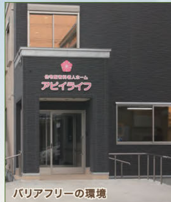
バリアフリーの環境