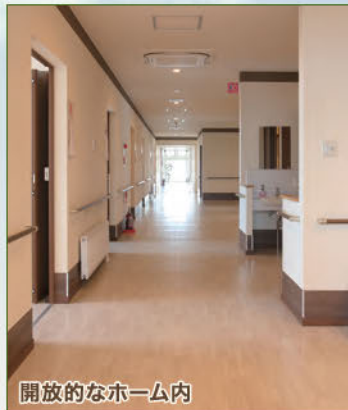
開放的なホーム内